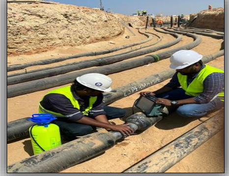
فريق الاختبارات اللائقية أثناء إجراء اختبار الصفيح المرهلي بالأموح فوق الصوتية (PAUT)