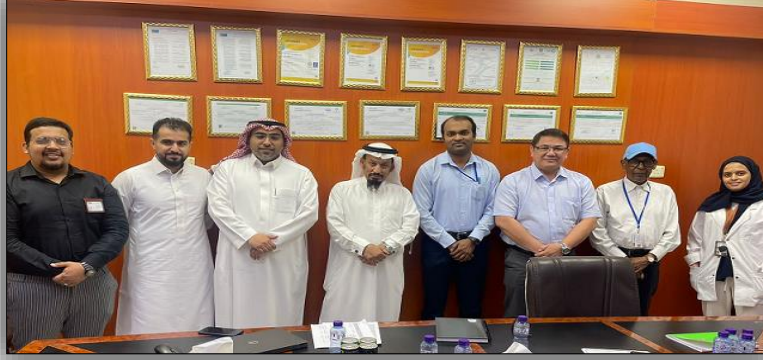
اكتمال أعمال التدقيق بنجاح في قسم الميكروبيولوجي بمقرنا الرئيسي في المملكة العربية السعودية