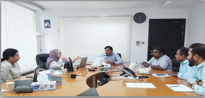
اكتمال عملية تدقيق نظام الاعتماد الوطني "إيناس" في منشأتنا في أبوظبي